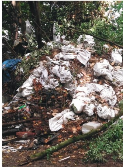
Comment lutter contre les dépôts sauvages ?